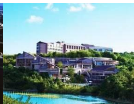
ホテル近鉄 アクアヴィラ伊勢志摩