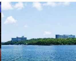
志摩観光ホテル(クラシック&ベイスイート)