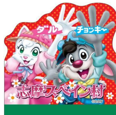
オリジナルメモ帳【New】