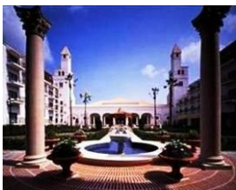
ホテル志摩スペイン村