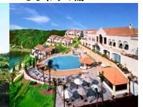
プライムリゾート賢島

放送原稿・掲載記事にご使用いただく場合は、必ずご確認くださいませようお願い申し上げます。