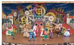
「ドンキホーテとみんなの大時計」