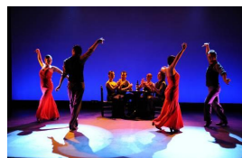
「カフェ・カンタンテ」