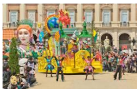
「エスパーニャカーニバル」