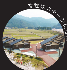
女性はコテージに宿泊