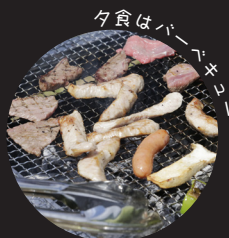
夕食はバーベキュー