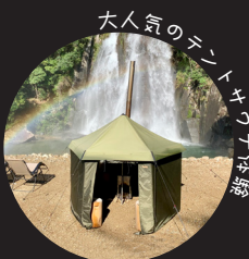
大人気のテントキャンプ体験