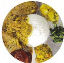
サブクチミレガ スパイスカレー他