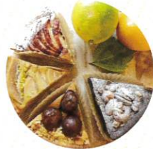
あゆみ工房 タルト、パイ他