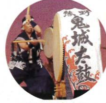
熊野鬼城太鼓 寄せ太鼓