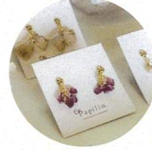
Papilio ハンドメイドアクセサリー