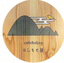
Kumano はしもと屋 ハンドドリップコーヒー他