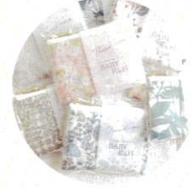
BABY R&H ハンドメイド雑貨