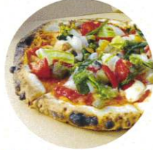
創作レストラン 日和 ピザ、パスタ、ドリンク他