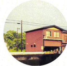
cafe scale 焼き菓子