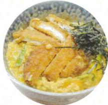
大石家 丼モノ、おにぎり他