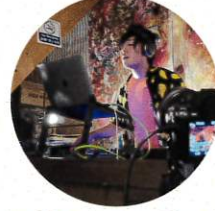
shuffle stream チーム DJ