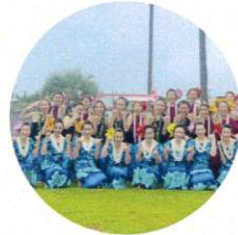
Hana Hana フラダンス