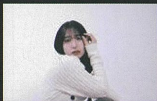
松坂城跡本丸会場 特設ステージ