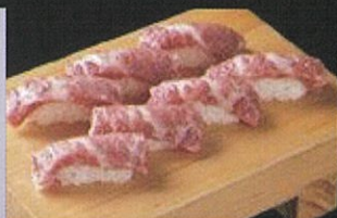
松坂城跡本丸下段・二ノ丸会場 グルメエリア