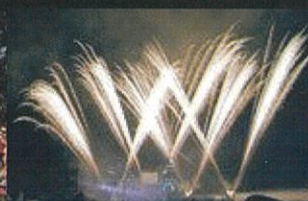
フィナーレ 花火ショー