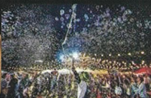
ナイトパブルショー