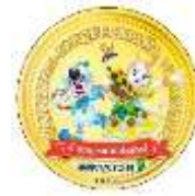
オリジナル缶バッジ (イメージ)

パークのキャストにスペイン語のあいさつ「オラ！」と声をかけてスタンプを集めたお子さまに、オリジナル缶バッジをプレゼント。 ※小人チケットでご入園の方が対象です。