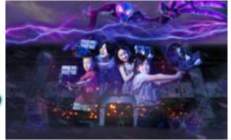
拡張現実アトラクション「オバケハンター」