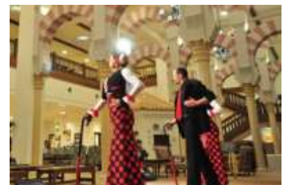
ホテルフラメンコショー