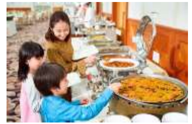
ファミリーバイキング