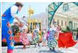
「バイレ・デル・カピタン ～ダンスフェスタの主役はキミだ～」