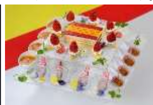
「スパニッシュデザートプレート」