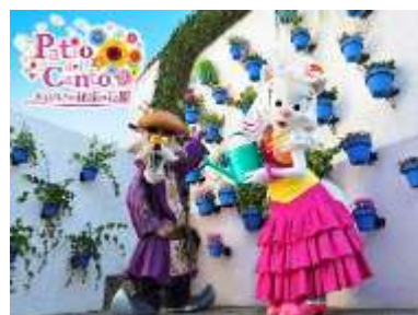
新キャラクターショー 「パティオ デル カント～ダルシネアの秘密の花園～」