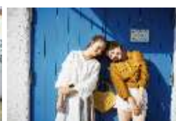
「サンタクルス通り」 のカラフルな扉