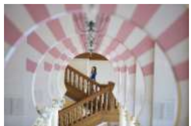
本場スペインさながらの趣きあるロビー