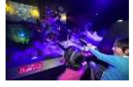
「アルカサルの戦い “アデランテ”」