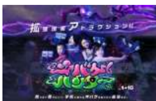
拡張現実アトラクション 「オパケハンター」