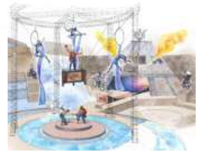
新ライブスペクタクル 「シルコ・デ・ティエラ～ネオ・レジェンド～」