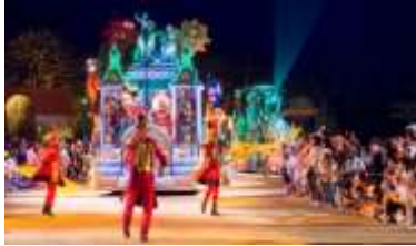
ナイトパレード 「エスパーニャカーニバル “アデランテ”」