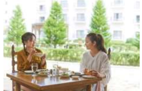
ホテル志摩スペイン村 優雅にランチを