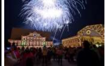
花火と音楽の競演 「ムーンライトフィナーレ」イ