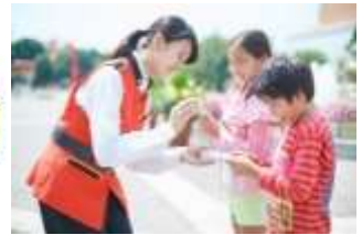
「オラ！スタンプラリー」