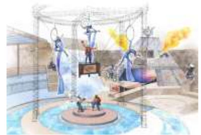
新ライブスペクタクル 「シルコ・デ・ティエラ ～ネオ・レジェンド～」

【上演期間】4月29日(水・祝)～5月6日(水・休) ※夏休み期間7月18日(土)～8月31日(月)も上演いたします。