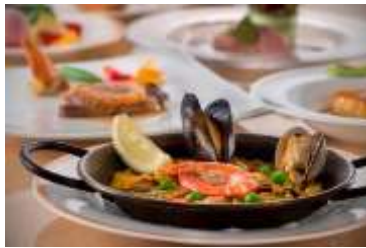
本格的なスペイン料理