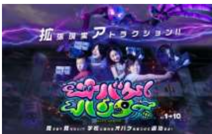
拡張現実アトラクション 「オバケハンター」