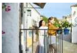
「サンタクルス通り」 の街並み

美しい白壁を色鮮やかな鉢や扉が彩るサンタクルス通りをはじめとする異国情緒あふれるスペインの街並み、スペインを舞台にした3Dアート「3Dトリックツアー」、南スペインの雰囲気が漂うホテルの内観や中庭など、写真映えするスポットがたくさん。写り込みを気にせず、満足のいくまで写真をお撮りいただけます。たくさん撮影して、お気に入りのショットを友達や家族とシェアしてお楽しみください。