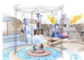
新ライブスペクタクル 「シルコ・デ・ティエラ ～ネオ・レジェンド～」