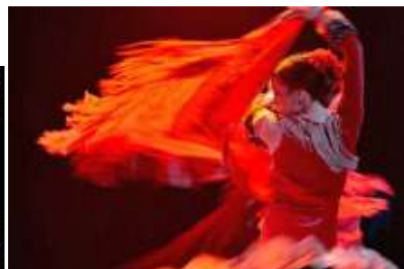
新フラメンコショー「クラシコス」