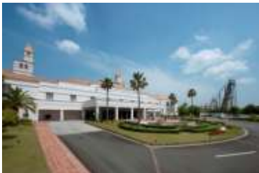
ホテル、テーマパークを存分に楽しむ