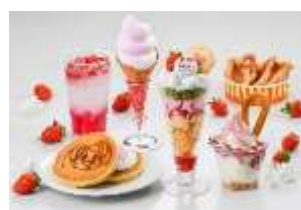
「いちごスイーツ各種」