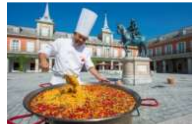
「大鍋パエリア」の販売