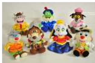
オリジナル衣装のぬいぐるみ ※4月中頃から販売予定