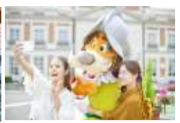
「キャラクターグリーティング」