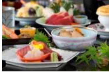
伊勢志摩の食材を贅沢に使った日本料理