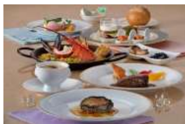
伊勢海老、黒鮑をつかったスペイン風コース料理