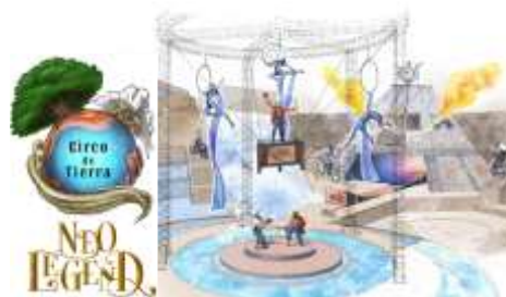
新ライブスペクタクル 「シルコ・デ・ティエラ～ネオ・レジェンド～」