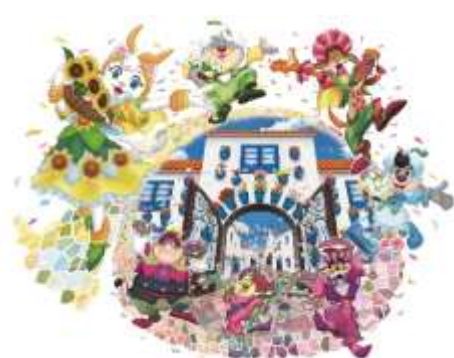
2020年 キャラクター新デザインイラスト

花をテーマにしたキャラクターの新デザインイラストのフォトスポットや、より美しくカラフルになるサンタクルス通りなどインスタ映えするロケーションで、友だちやご家族と一緒に思い出に残る記念撮影をお楽しみください。