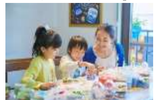
「手作りジェルキャンドル」

【料金】手作りジェルキャンドル 1,580 円～ “樹になる木” ドアプレート 330 円～ お絵かきヒノキのネームプレート 770 円～