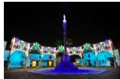
光と音のファンタジア「イサベルの光」