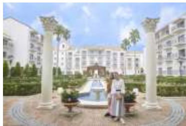
花と緑があふれるパティオ（中庭）