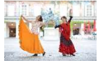
「おでかけフラメンコ」

【料金】2,500 円 (120 分) ※レンタルは女性衣裳のみ 身長 80cm～