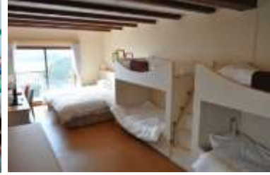
ファミリールーム