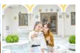
「ホテル志摩スペイン村」