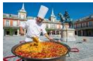
「大鍋パエリア」の販売