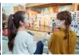
「パティオ デル カント ～ダルシネアの秘密の花園～」