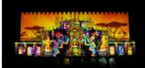
プロジェクションマッピング 「太陽・月 ラブソディア」