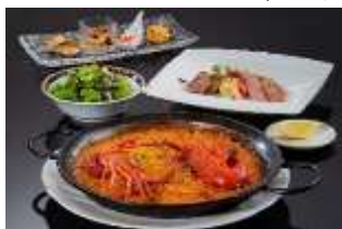
「伊勢志摩産 伊勢海老 パエリアセット」※2名分から

地元食材にこだわったメニューや春の味覚“いちご”を使ったスイーツなど春限定メニューが登場します。伊勢志摩産の伊勢海老を使ったパエリアや松阪牛重など、旅先ならではの贅沢な味覚をご堪能ください。スイーツでは、スペインのおやつをテーマにしたデザートプレートやキャラクターをモチーフにした見た目も映えるメニューで、カップルやグループでシェアしてお楽しみいただけます。