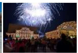
ナイトスペクタクル 「エスティバル フェスティバル」