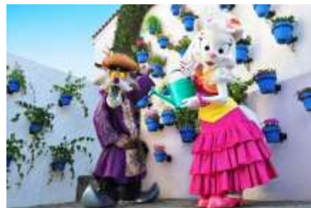
新キャラクターショー 「パティオ デル カント～ダルシネアの秘密の花園～」