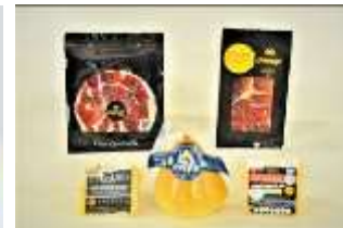
スペイン産の生ハム、チーズ ※3月20日から販売予定