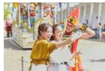
エンターテイナーと思い出のショット