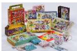
キャラクターグッズ・お菓子

花をテーマにしたキャラクターの新デザインイラストのグッズやお菓子などを販売します。またキャラクターのぬいぐるみがオリジナル衣装バージョンで新登場します。ショップ「ファボリト」には、スペインから直輸入の生ハムやチーズ、ワイン、ジャムなどがずらりと並ぶショーケースが登場し、スペインの珍しい食材も販売します。日用品からファッション、食料品まで個性豊かなスペイン雑貨を取り揃え、シーズンごとに変わるテーマと新商品でいつご来園いただいても新しい発見があります。