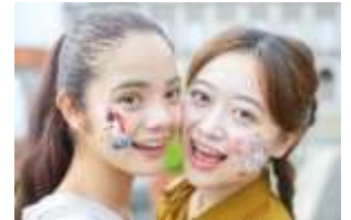
「フェイス&ボディペインティング」