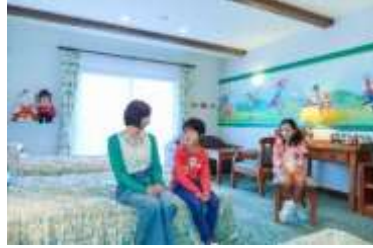
キャラクタールーム