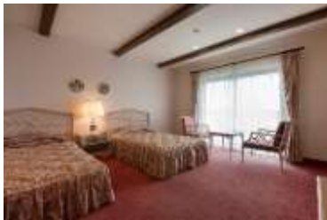
スタンダードツインルーム

テーマパークをゆったりと満喫できるホテル2DAYパスポートの販売、温泉入浴の無料などのホテル特典も充実。Wi-Fi 無料通信サービスを全館完備。インテリアの隅々までこだわった40.5㎡のゆったりとしたスタンダードツインルーム、キャラクタールーム、1部屋に6名様までご宿泊いただけるファミリールームに、本格的なスペイン料理や日本料理のコース料理、小さなお子様でも利用しやすいファミリーバイキングで多種多様なお客様の要望に合わせたプランをご用意しております。南スペインの面影漂うホテルロビーでは上演日限定でフラメンコショーが開催され、まるでスペインにいるかのような優雅で非日常なひとときをお過ごしいただけます。