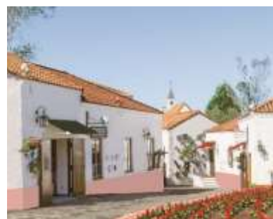
より美しくカラフルになるサンタクルス通り