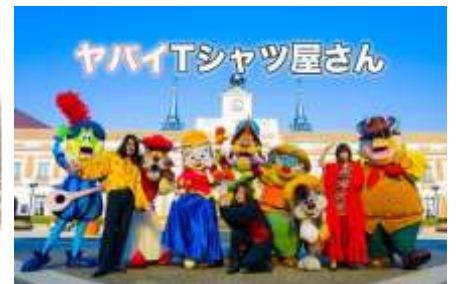
ヤバイTシャツ屋さん “スペインのひみつ解明 ONE-MAN SHOW” in 志摩スペイン村