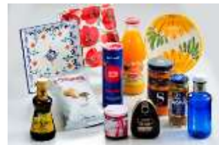
スペインから直輸入の様々な 輸入食品等