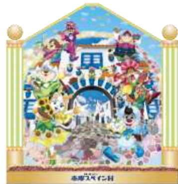
エスパーニャ通りの新フォトスポット