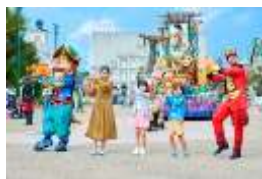
「エスパーニャカーニバル “アデランテ”」

⑥スパニッシュパフォーマンス 【上演期間】 2月上旬～11月29日（日）の土日祝