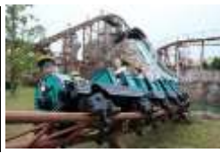
「グランモンセラー」