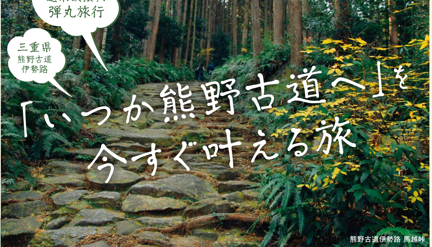
熊野古道伊勢路 馬越峠